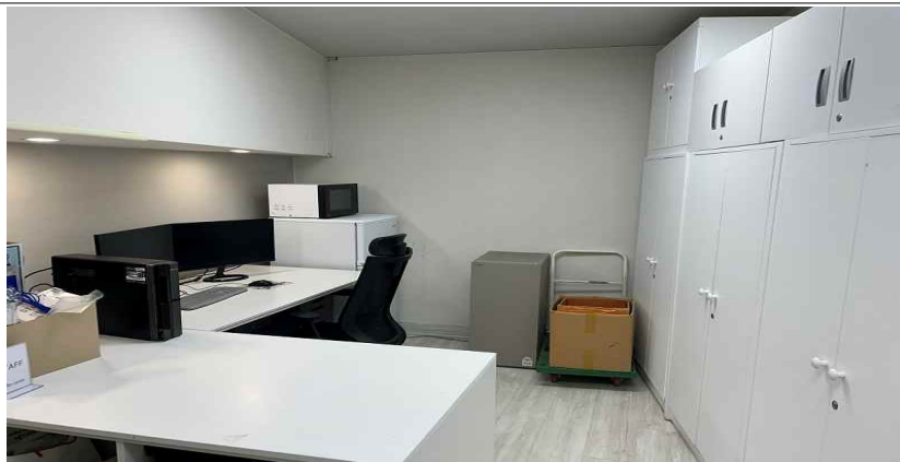
<근무 장소_우표박물관 사무공간>